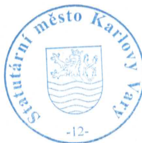
Bc. Jiřina Orlichová vedoucí odboru